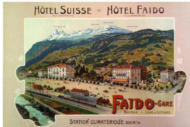
Faido 1913 Belle Epoque

Die gute Erreichbarkeit mit der Bahn sorgte bereits im 19. Jahrhundert dafür, dass Faido zu einem bevorzugten Ferienort des Mailänder Grossbürgertums und Adels wurde. Imposante ehemalige Hotels und Villen im Liberty-Stil sind offenkundige Zeugen dieser ruhmreichen Vergangenheit.