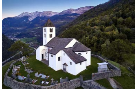
Kirche San Martino

Am Abreisetag brechen wir das Fasten mit einem Apfel und stimmen uns auf die Aufbautage ein. Mit einem leichten Mitta- gessen und einer letzten Gesprächsrunde beschliessen wir die Fastenwoche. Gestärkt durch persönliche Erfahrungen und ge- rüstet mit guten Tipps und tollen Rezep- ten für die Aufbautage kehren Sie erholt in den Alltag zurück.