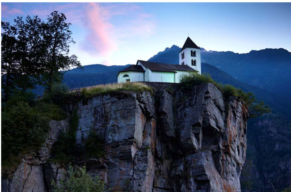
Kirche San Martino