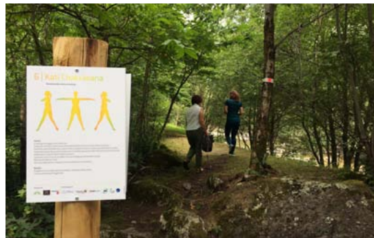
Auch ein Weg

Auf dem Yoga-Pfad von Faido erwarten Sie wohltuende Begegnungen. Damit sind auch die zweihundert bis dreihundert Jahre alten Kastanienbäume gemeint, die dessen Philosophie