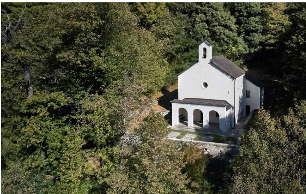
Kirche Madonna delle Rive

Die Madonna delle Rive hat eine sehr sanfte, feminine und hingebungsvolle Energie und ist energetisch mit dem Kapuzinerkloster, dem Ostello dei Cappuccini und dem Piumogna-Wasserfall verbunden. Wer den Wasserfall besucht oder den gesamten Yoga-Pfad geht, kann eine Bereicherung auf emotionaler, mentaler und spiritueller Ebene genießen.