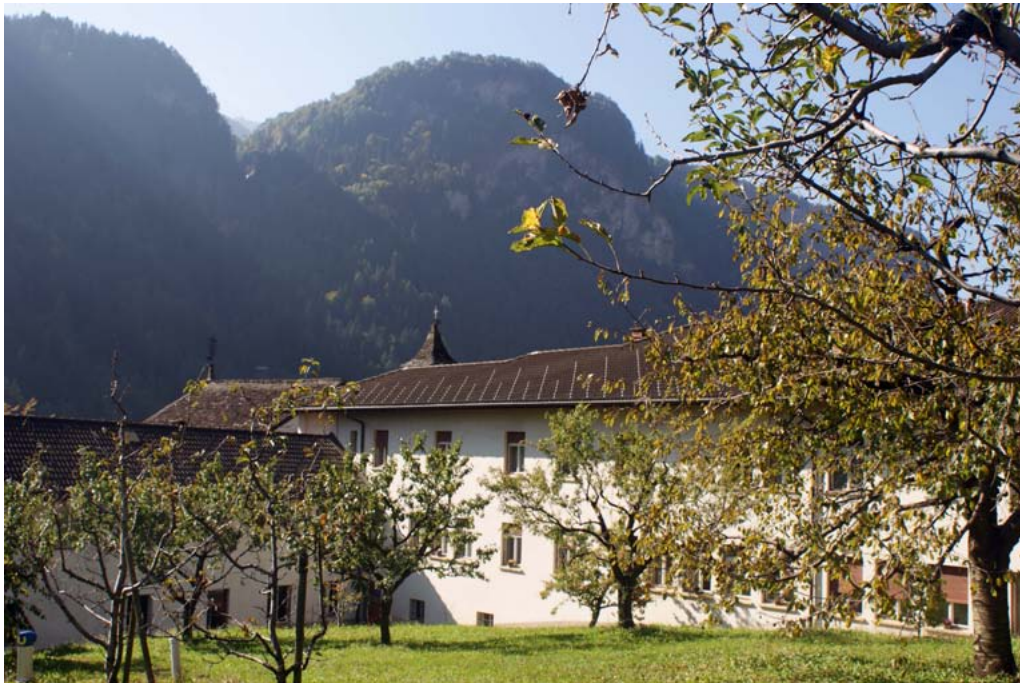
Ostello dei Cappuccini

ner Tagungsraum sowie der Gymnastiksaal, können multifunktional genutzt zu werden.