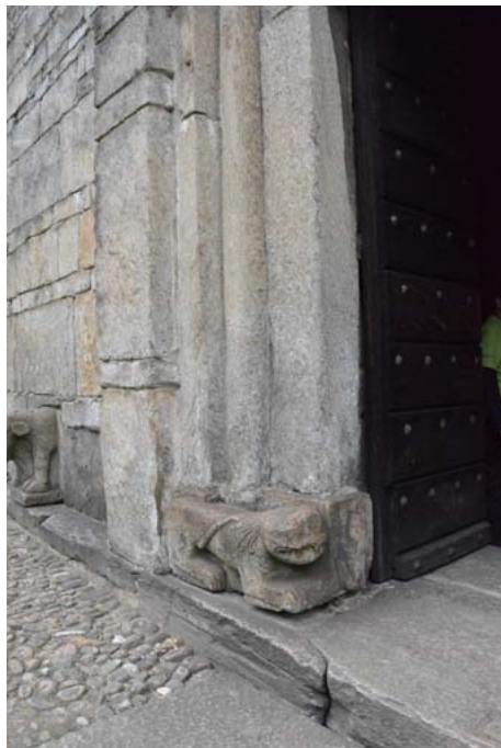
Kirche San Nicolao