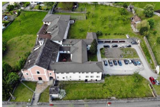
Kirche St. Francesco mit Kapuzinerkloster und Herberge

Der Garten, das TV-Zimmer und die Bibliothek mit einem Bereich für Naturheilkunde und Alternativmedizin laden zum Verweilen ein. Ein grosser und klei-